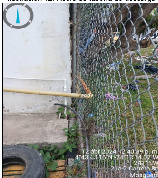
Ilustración 12. Retiro de tubería de descarga

En el punto dos se retiró la tubería que descargaba directamente al suelo y ya no se observa anegación en el predio contiguo.