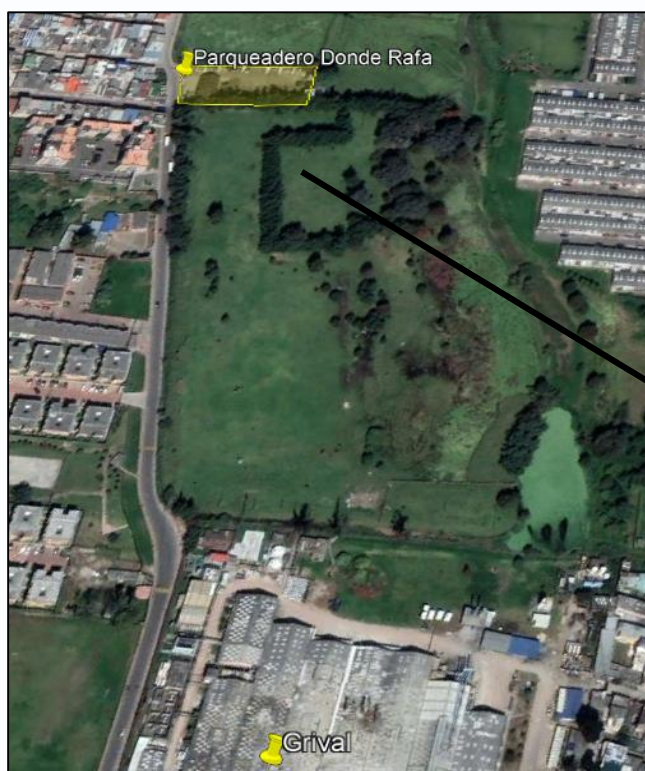
Ilustración 1. Ubicación predio

Teniendo en cuenta que ante el municipio de Funza se interpuso queja por el vertimiento de aguas residuales domésticas, se realizaron visitas técnicas los días 15 y 19 de enero por parte del personal adscrito a la Secretaría de Ambiente y Bienestar Animal, de conformidad con las actas de visita ambiental No. 004 y 007, en el establecimiento comercial “Parqueadero Donde Rafa” (polígono amarillo), ubicado en el la vereda Siete Trojes en la calle 23 con carrera 9, detrás de la empresa Grival y contiguo al barrio Villa María etapa 4 del municipio de Mosquera, coordenadas 4°43'3.45" N y 74°13'14.172" W, como se muestra en la siguiente ilustración: