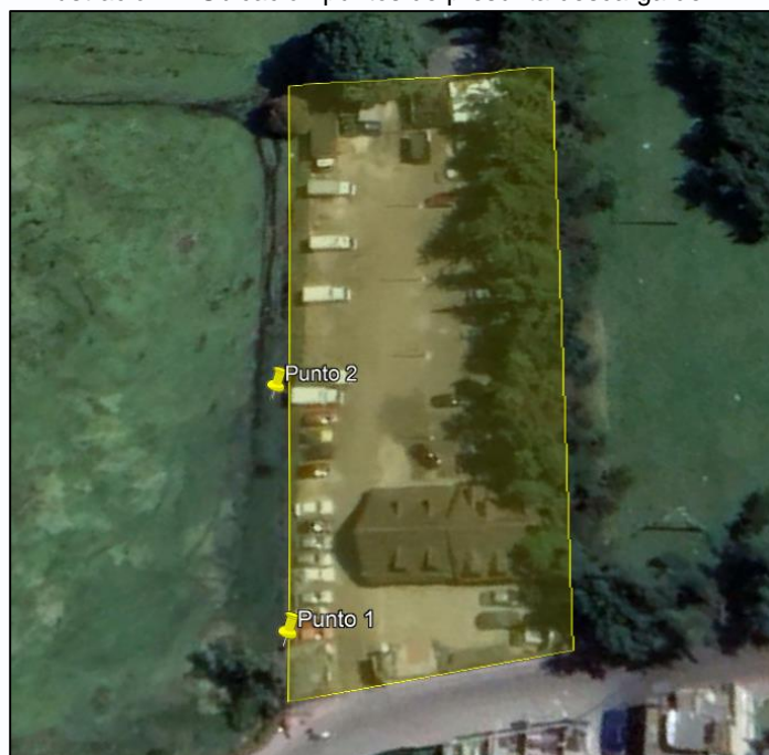
Ilustración 4. Ubicación puntos de presunta descarga de ARD

En el recorrido de inspección se identificaron dos puntos de presunta descarga de aguas residuales domésticas al suelo del predio contiguo, en el cual se realizan actividades pecuarias.