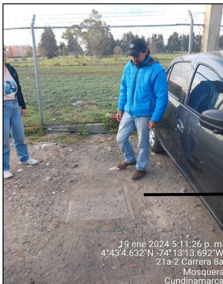
Ilustración 8. Ubicación posible pozo séptico

Las personas que atienden las visitas, manifiestan que el predio no está conectado al sistema de alcantarillado público, toda vez que no hay cobertura por parte de las empresas prestadoras, por lo tanto, cuentan con pozo séptico, sin embargo, no fue posible su inspección, ya que se encuentra tapado.