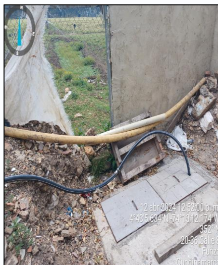
Ilustración 14. Pozo Séptico Nuevo

El pozo séptico antiguo se habilitó como tanque de almacenamiento de las aguas residuales, las cuales son bombeadas a través de una bomba sumergible y conducidas en manguera a nivel del suelo al pozo séptico nuevo, que se encuentra construido en su totalidad.