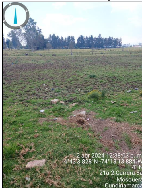
Ilustración 13. Predio sin anegación

El pozo séptico antiguo se habilitó como tanque de almacenamiento de las aguas residuales, las cuales son bombeadas a través de una bomba sumergible y conducidas en manguera a nivel del suelo al pozo séptico nuevo, que se encuentra construido en su totalidad.