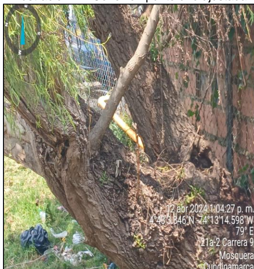
Ilustración 11. Conexión punto uno ajustada

En el punto dos se retiró la tubería que descargaba directamente al suelo y ya no se observa anegación en el predio contiguo.