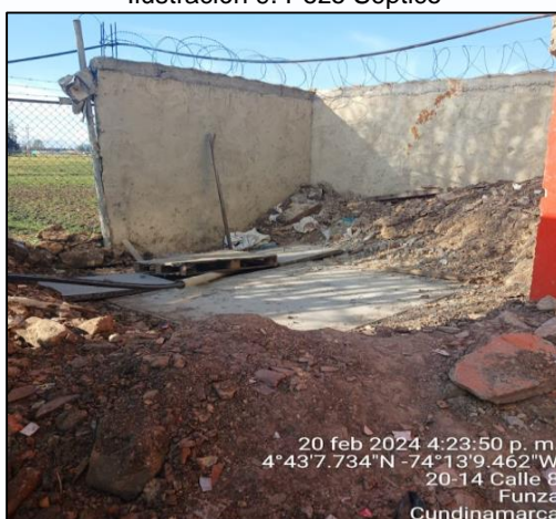
Ilustración 9. Pozo Séptico

Igualmente, se observan las dos tuberías de descarga evidenciadas en visitas anteriores, por lo cual desde la Inspección Primera de Policía se otorga plazo hasta el día 27 de febrero para que se realice el respectivo retiro de las mismas.