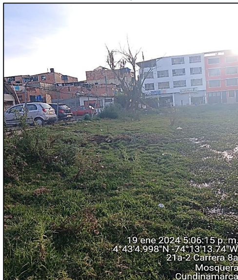
Ilustración 7. Anegación del predio

Las personas que atienden las visitas, manifiestan que el predio no está conectado al sistema de alcantarillado público, toda vez que no hay cobertura por parte de las empresas prestadoras, por lo tanto, cuentan con pozo séptico, sin embargo, no fue posible su inspección, ya que se encuentra tapado.