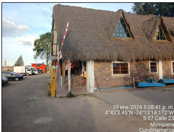
Ilustración 2. Hospedaje