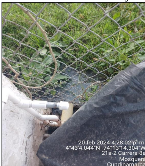
Ilustración 10. Tuberías de descarga

Igualmente, se observan las dos tuberías de descarga evidenciadas en visitas anteriores, por lo cual desde la Inspección Primera de Policía se otorga plazo hasta el día 27 de febrero para que se realice el respectivo retiro de las mismas.