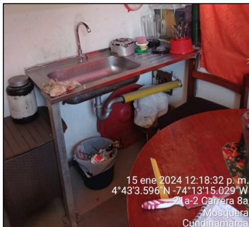
Ilustración 5. Punto 1 vertimiento ARD

En el primer punto, se evidenció tubo de descarga de aguas residuales domésticas al suelo procedentes del lavaplatos de la caseta de vigilancia.