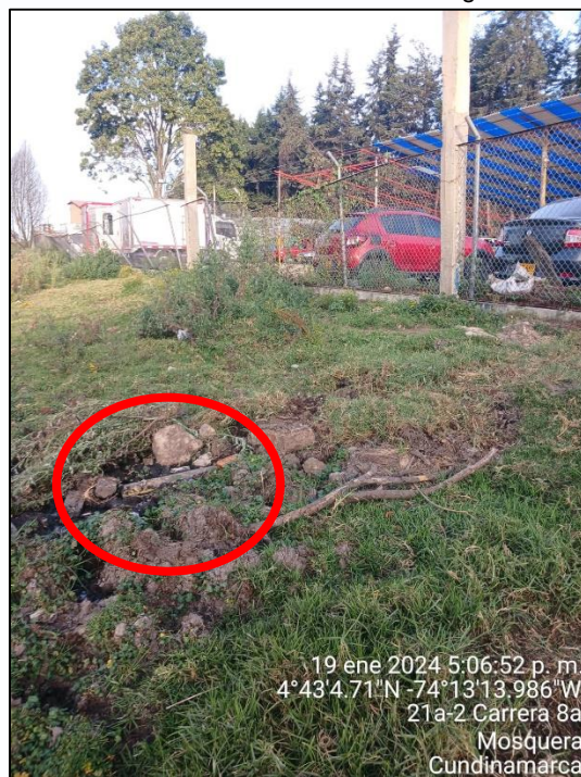
Ilustración 6. Punto de descarga 2